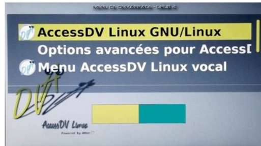
Image : Le GRUB

Options avancées Menu Access DV Vocal, Arrêt Redémarrage Clonezilla